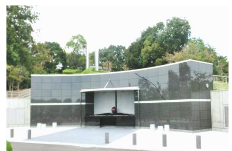
(写真は兵庫県明石市霊園)

少子化や核家族化で、墓地のニーズも多様化になっていることに加えて、お墓を守る人（墓守）の減少により墓じまい問題がクローズアップされている現状があります。2年前の12月定例議会で一般質問した合葬墓地の必要性が、認められて、長田霊園内に整備されることになりました。敷地面積は約1,800平方メートルで、約3千体の埋葬規模となり令和6年に供用開始予定であります。